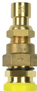
CALIBRE ÉQUIPÉ DU SYSTÈME CLAP